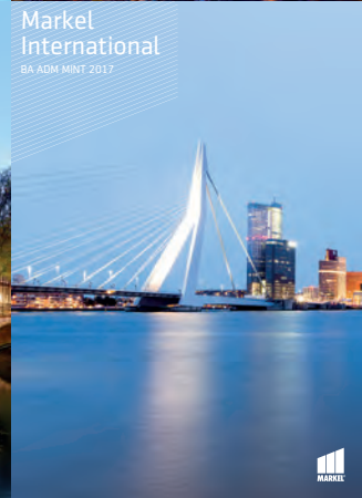
Markel International BA ADM MINT 2017