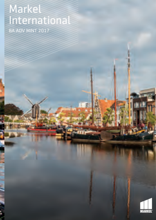
Markel International BA ADV MINT 2017