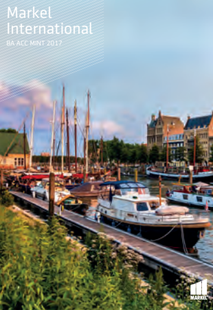
Markel International BA ACC MINT 2017