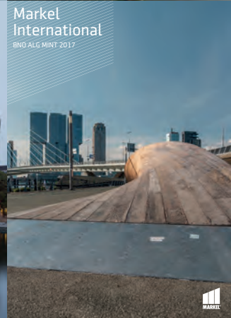
Markel International BNO ALG MINT 2017