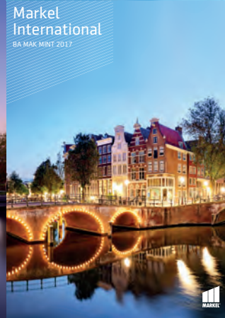
Markel International BA MAK MINT 2017