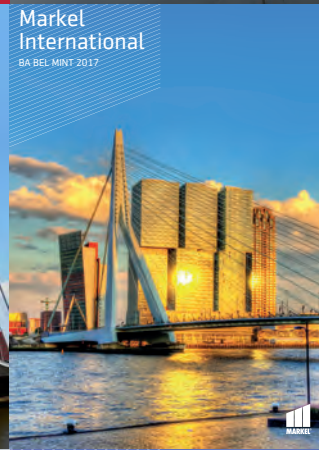
Markel International BA BEL MINT 2017