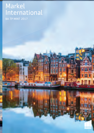
Markel International BA TP MINT 2017