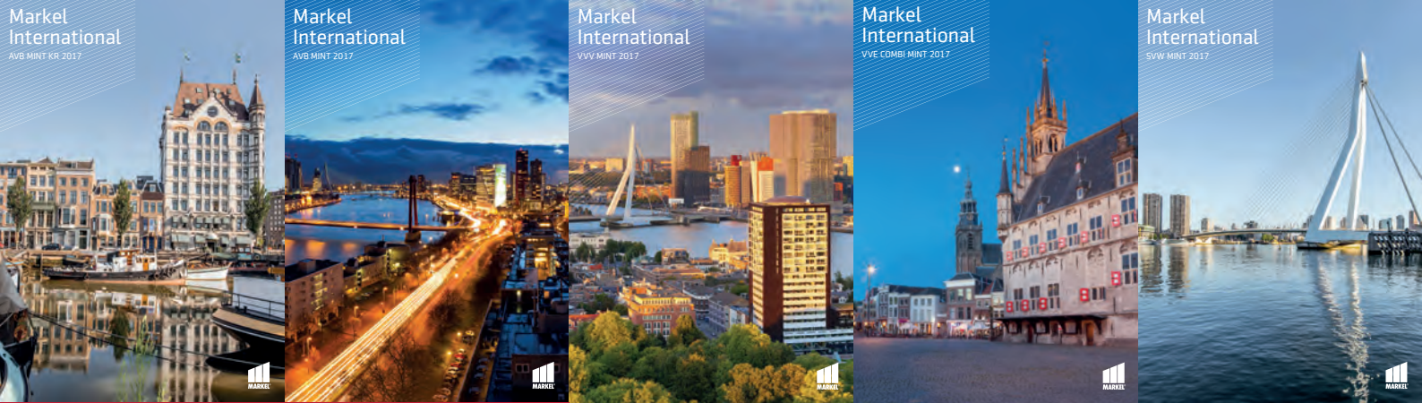
Markel International AVB MINT KR 2017