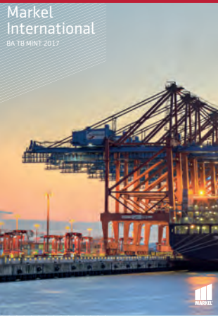
Markel International BA TB MINT 2017