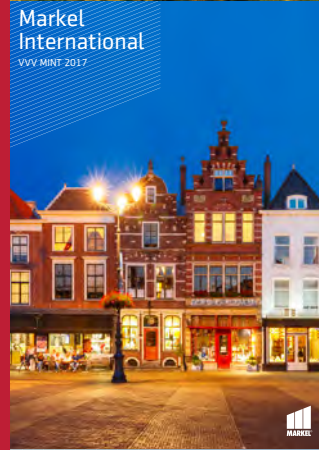
Markel International VVV MINT 2017