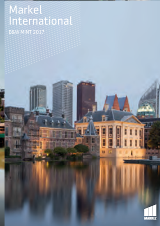
Markel International B&W MINT 2017