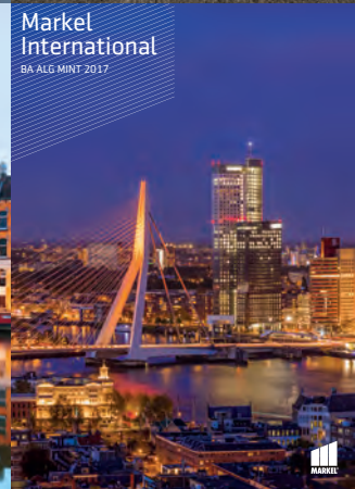
Markel International BA ALG MINT 2017