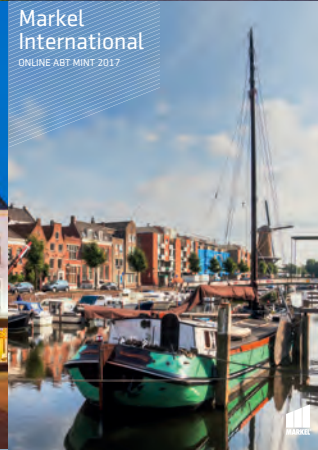
Markel International ONLINE ABT MINT 2017