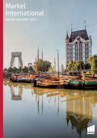
Markel International ONLINE AAV MINT 2017